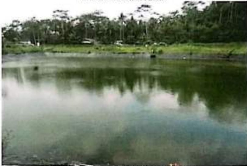
MAKAM PANJANG/ASTONO PANJANG